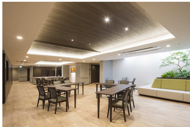
2020年増築 中間期介護フロア (一般居室の入居者向けに健康維持サービス等を提供)