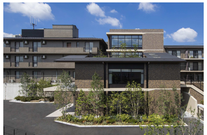
2020年増築 共用棟外観