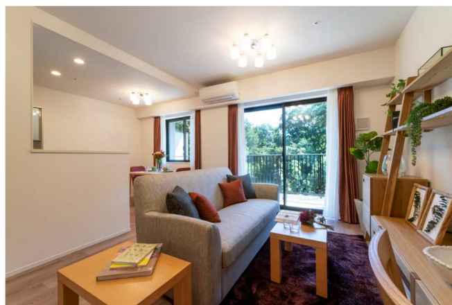
2020 年増築 東棟モデルルーム

本プロジェクトにおける「自立期と介護期をつなぐ住宅」というテーマ、そしてその空間環境とオペレーションのあり方は、これからの日本における重要な課題となるものである。ここでは既存のゆとりある環境の価値を損ねることなく、増築以前の風景を引き継ぎながら機能拡充が行われ、入居者の平穏で豊かな日常を支える空間として落ち着いた環境が生み出されている。ソフトサービスのあり方も含め、ここで生まれる生活風景と新たな知見に期待したい。