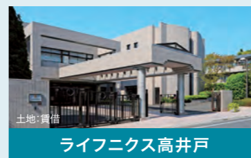
ライフニクス高井戸

施設名:ライフニクス高井戸 施設類型:介護付有料老人ホーム 所在地:東京都杉並区高井戸東四丁目12番31号 総室数:137室 開業:1989年11月、事業承継:2008年10月