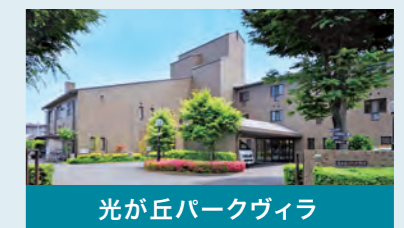
光が丘パークヴィラ

施設名:グランクレール馬事公苑 施設類型:住宅型有料老人ホーム 所在地:東京都世田谷区上用賀一丁目22番23号 総室数:139室 開業:2006年5月、事業承継:2011年4月