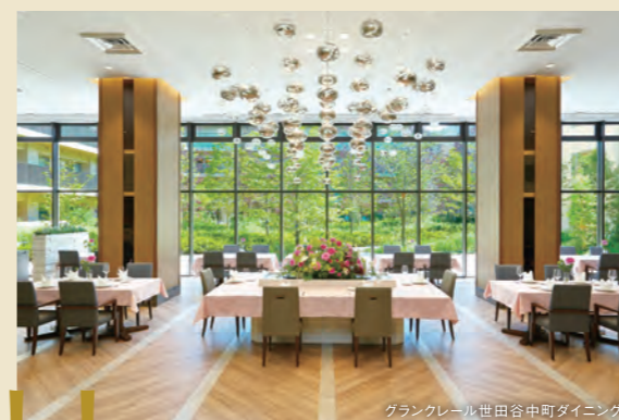
グランクレール世田谷中町ダイニング