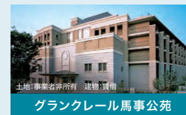
グランクレール馬事公苑

施設名:ライフニクス高井戸 施設類型:介護付有料老人ホーム 所在地:東京都杉並区高井戸東四丁目12番31号 総室数:137室 開業:1989年11月、事業承継:2008年10月