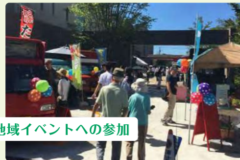
地域イベントへの参加

地域交流の場として、運動系・文化系以外にも循環型社会(SDGs)に貢献できるイベントなども展開するカルチャースクールです。