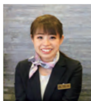
フロントスタッフ