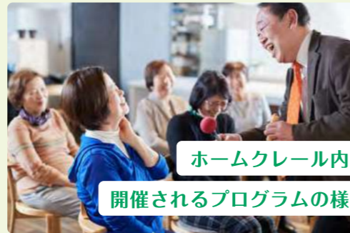
ホームクレール内で 開催されるプログラムの様子