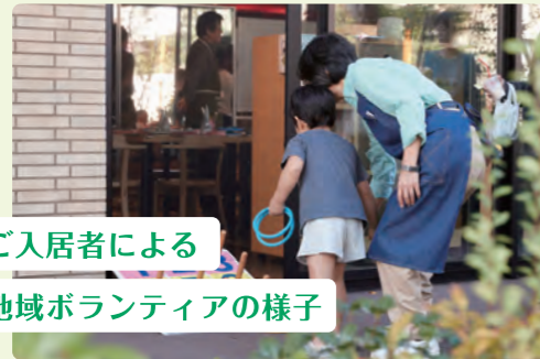
ご入居者による 地域ボランティアの様子