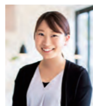
福祉用具専門相談員