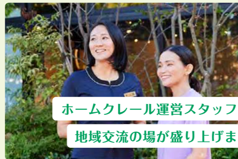
ホームクレール運営スタッフが 地域交流の場が盛り上げます

サービス拠点 | ホームクレール世田谷中町 ホームクレール横浜十日市場 ホームクレール立川 ホームクレールHARUMI FLAG