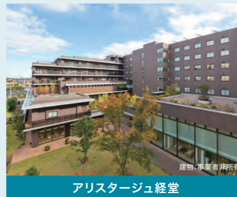
アリスタージュ経堂

施設名:アリスタージュ経堂 施設類型:介護付有料老人ホーム 所在地:東京都世田谷区経堂三丁目20番22号 総室数:146室 開業:2012年8月、介護業務受託:2017年5月 事業主体:京王ウェルシステージ株式会社